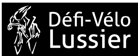
TABLEAU DE VISIBILITÉ